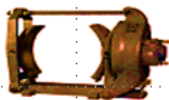
FREIOS SÉRIES E SHUNT