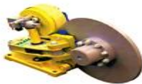
FREIOS A DISCO