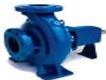
BOMBA KSB SUBMERSA