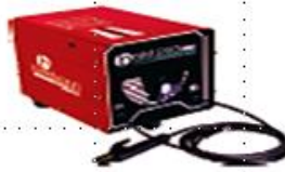
MÁQUINAS DE SOLDA